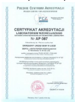
Certyfikat Akredytacji Nr AP 087